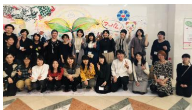
ギャラリーアルファ(八犬堂)

可能性を秘めた若手作家をいち早く見出し、その才能が開花することを美術ファンと共に応援するための企画としてスタートした公募展「いい芽ふくら芽」の開催などを手がけ、若手アーティストの育成のノウハウを積み上げた「八犬堂」の常設ブースを展開し、若手アーティストの発掘・育成を行います。