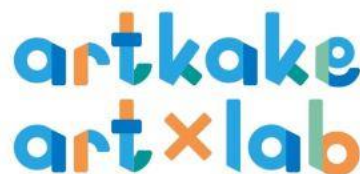
アトカケアートラボ

「アートをきっかけに、人と人がつながっていくことをめざす」岐阜大学の学生スタートアップである「artkake (アトカケ)」が運営する「artkake ART LABO(アトカケアートラボ)」。