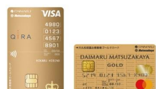
大丸松坂屋お得意様 ゴールドカード