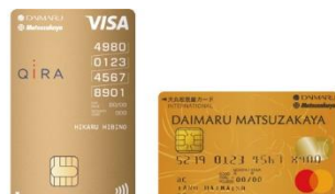
大丸松坂屋 ゴールドカード