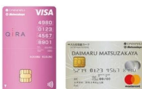
大丸松坂屋 カード