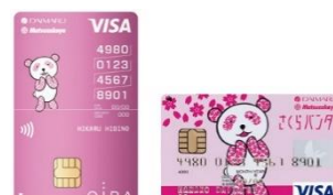
さくらパンダ カード