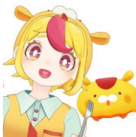
おむらいす食堂氏

また講師やセミナー、メディア出演、書籍執筆などを通しノンデザイナーやノンプロ向けに「作れる面白さ」を精力的に発信している。